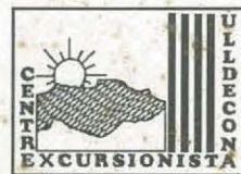
BEL, una de les visites del CEU

Butlletí editat pel Centre Excursionista Ulldecona (CEU)